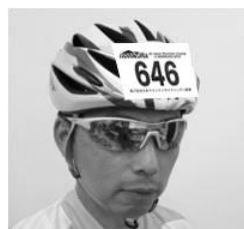
▲ヘルメットシールの取付